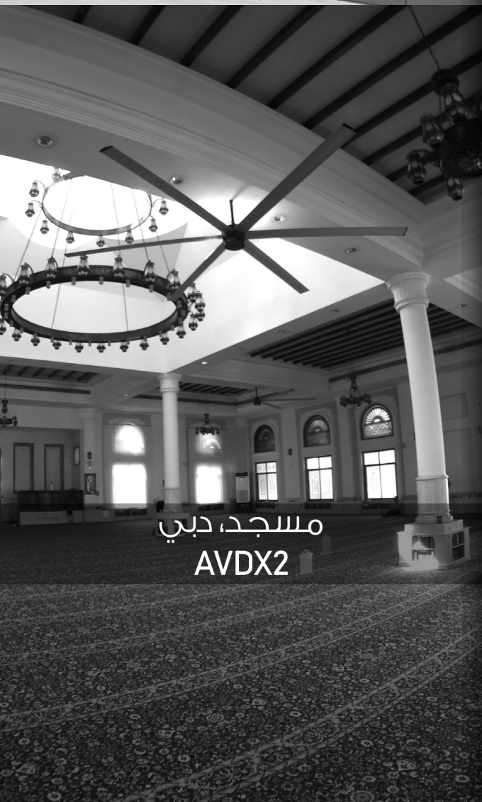
مسجد، دبي AVDX2