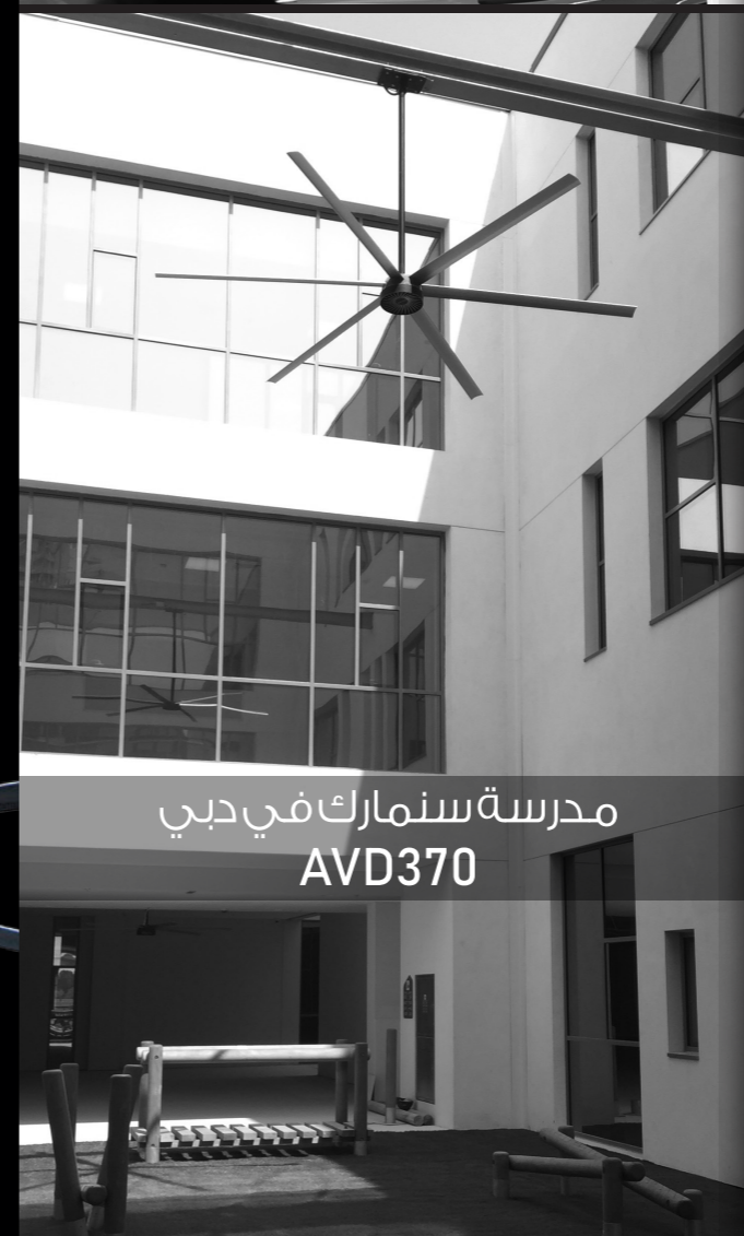
مدرسة سنمارك في دبي AVD370