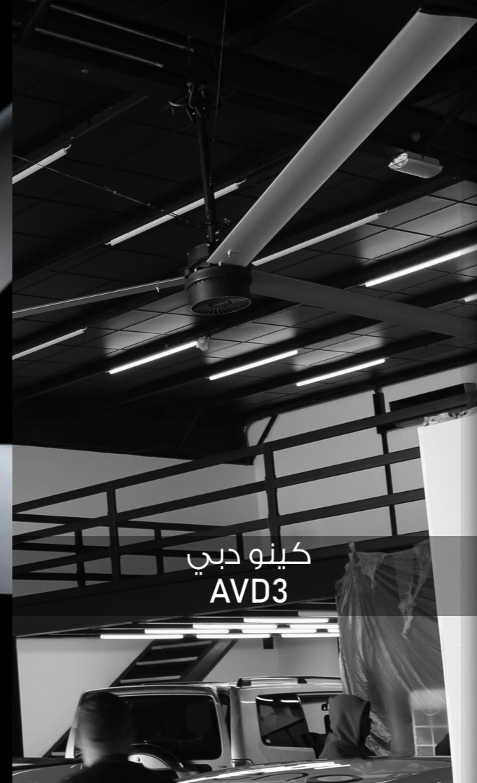
كينو دبي AVD3