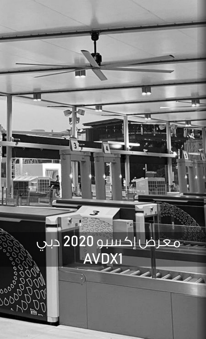
معرض إكسبو 2020 دبي AVDX1